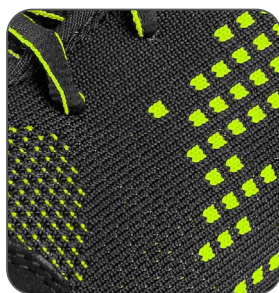
svršek z odolného polyesteru odolný polyesterový zvršok resistant polyester upper cholewka z wytrzymałego poliestru