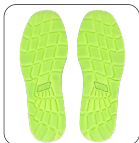
podešev podošva outsole podeszwa