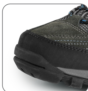
zesílená přední část proti okopu reinforced overcap nosek z wzmocnieniem