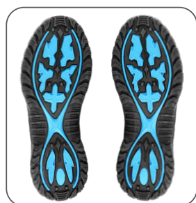
podešev outsole podeszwa