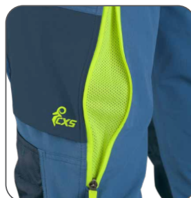
ventilace na stehně ventilácia na stehne thigh ventilation wentylacja na nogawce