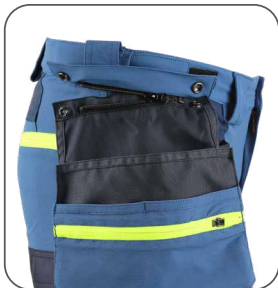
odepínací kapsy odpinanie vrecká detachable pockets odpinane kieszenie