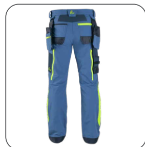
zadní strana zadná strana back side z tyłu