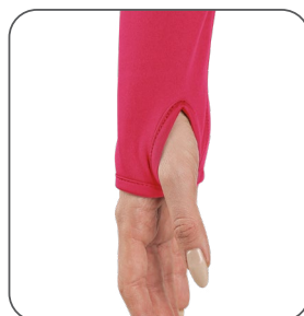
otvor na palec na rukávu otvor na palec na rukáve thumb hole on the sleeve otwór na kciuk na rękawie